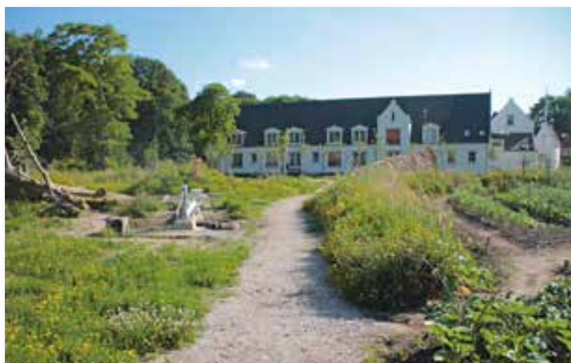
De TorenTuin Zaltbommel met links het singelpark ter hoogte van de Virieusingel.

en zijn aanstelling als 'stadsarchitect' hebben waarschijnlijk deze mooie opdracht mogelijk gemaakt.