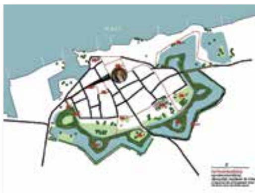
Wandelkaart behorende bij de tentoonstelling 'Natuurlijk, mijnheer De Virieu' (ontwerp Carien van Boxtel, wandeling/route Roland Gieles).

den. In de loop van de zeventiende- en achttiende eeuw verloren de vestingwerken hun militaire functie en raakten ze in verval. In 1699 werden dubbele rijen iepen op de stadswallen geplant.