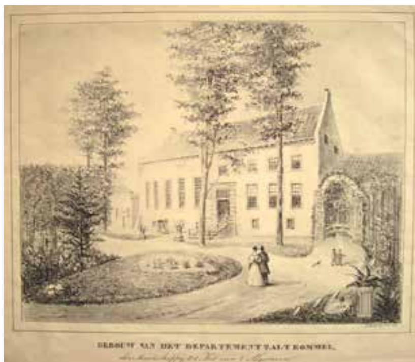
Prent van het Nutsgebouw en tuin (F.W. de Virieu, jaartal onbekend, collectie Stadskaasteel).

Met de tentoonstelling is er gelukkig hernieuwde aandacht voor de negentiende-eeuwse 'laag' die De Virieu heeft toegevoegd aan de middeleeuwse stadswallen. De visie 'Van Waal tot Waal' legt een solide basis voor het behoud en herstel van het singelpark en de betekenis daarvan voor de leefbaarheid en aantrekkingskracht van de vesting. De volgende stap is hopelijk een grondige tuinhistorische analyse en een doortimmerd restauratie- en beheerplan, zodat het unieke park weer toekomstbestendig wordt en niet alleen uitsluitend stoelt op de historische betekenis van bolwerken, binnen en buitengracht, stadsmuur en schootsveld maar ook recht wordt gedaan aan het negentiende-eeuwse ontwerp van De Virieu, waardoor Zaltbommel een