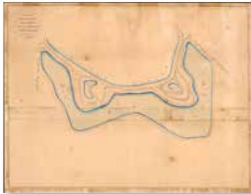
Ontwerptekeningen F.W. de Virieu van de singelparken, 1834.