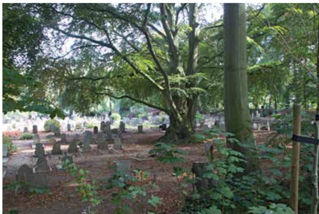
Foto van de 'vaasbeuk' op de Begraafplaats 'De Bossche Poort' in het singelpark Zaltbommel. De beuk dateert uit ca. 1825 (foto: Carien van Boxtel, september 2014).

landschapstijl, die in die periode zeer populair was. Zaltbommel was niet de enige vesting waar de stadswallen werden omgevormd: dit gebeurde eerder onder andere in 1820 in Leeuwarden door L.P. Roodbaard, in 1821 in Haarlem en in 1829 in Utrecht, beide door J.D. Zocher jr. Wat het Zaltbommelse singelpark bijzonder maakt, is dat hiervoor niet een van de destijds bekende tuinarchitecten werd aangetrokken maar een lokale 'amateur'. Zijn enorme lokale netwerk en betekenis voor de stad